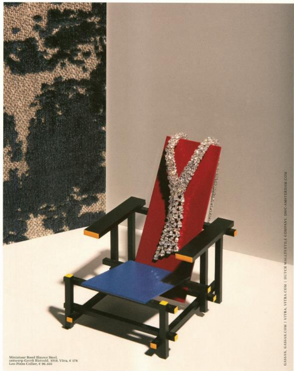
Miniatuur Rood Blauwe Stoel, ontwerp Gerrit Rietveld, 1918, Vitra, € 178 Leo Pizzo Collier, € 96.496