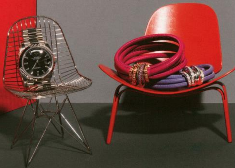
Van links naar rechts Metalen draadstoel Rolex Day-Date 40 MM witgoud President, € 38.750 Miniatuur 3-Broek Skalski, design Hans Wuyger, Vitra, € 500 De Gregorino roze armband, € 12.200 De Gregorino zwart armband, € 11.700

STYLING & PRODUCTIE ANNE-CHRISTINE HARTMAN MET DANK AAN DUTCH WALLTEXTILE COMPANY, CO VAN DER HORST, VITRA