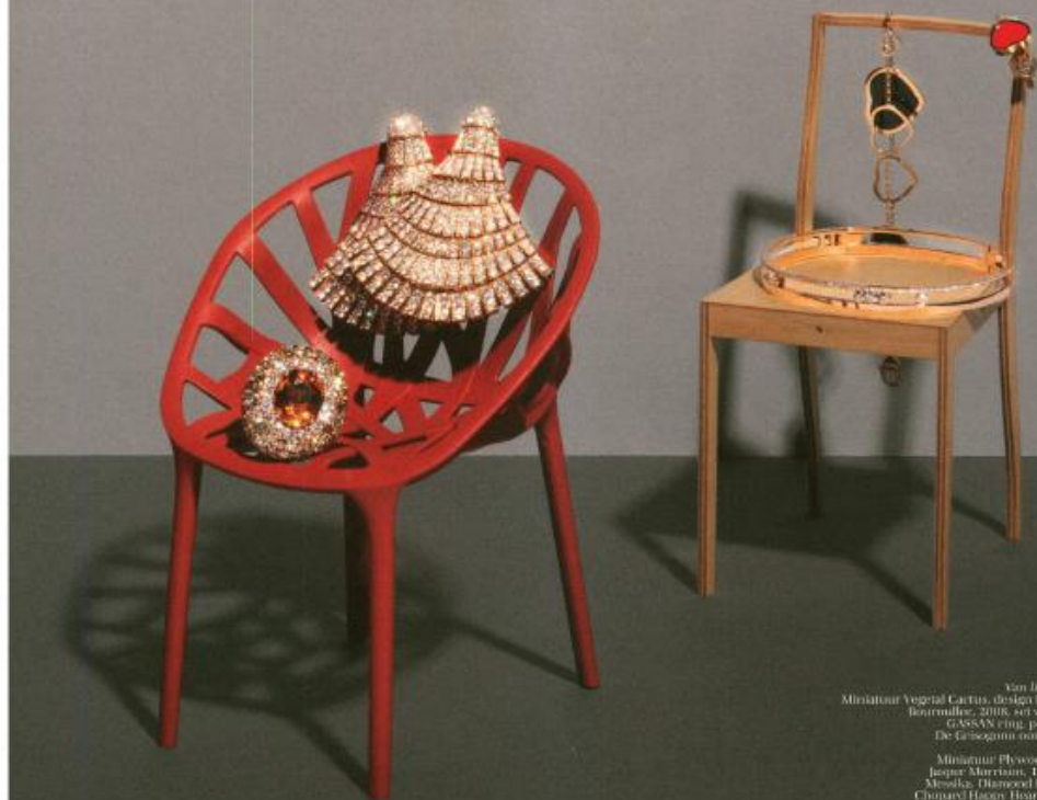
Van links naar rechts Miniatuur Vegetal Cactus, design Ronan & Erwan Bouroullec, 2006, set van 3, Vitra, € 87 GASSAN ring, prijs op aanvraag De Gregorino oorbelles, € 74.800 Miniatuur Plywood Chair, design Jaeger-Murphy, Birk Vitra, € 125 Mossika, Diamond Bracelet, € 8.500 Chopard Happy Hearts armband met rozet oren, € 2.200 Chopard Happy Hearts oorbellen met rood koraal, € 1.430